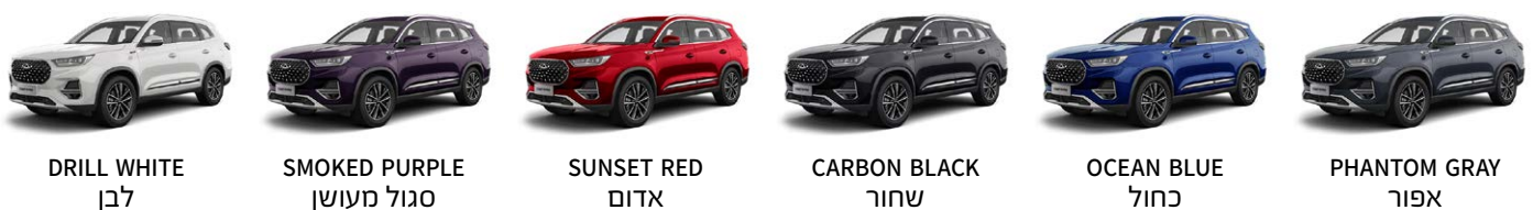
DRILL WHITE לבן